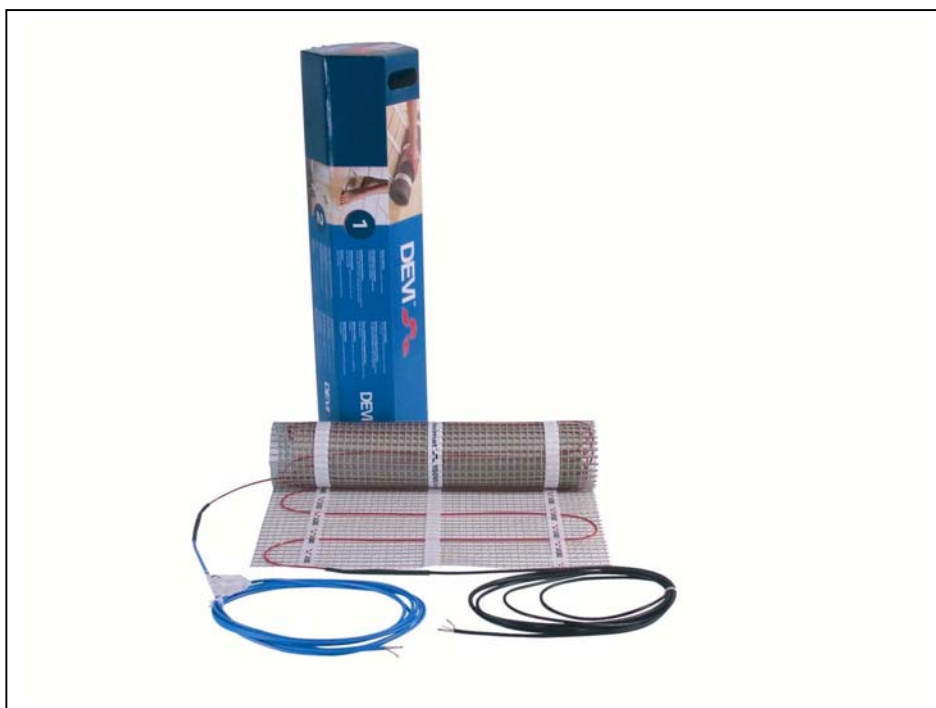
Рис. 1. Нагревательный мат devimat™ DSVF.

Нагревательные маты devimat™ DSVF (рис. 1) применяются для внутренней установки. Используются в ремонтируемых и тонких полах непосредственно под покрытие пола без формирования толстой цементной стяжки и устанавливаются в основном под плитку с плиточным клеем.