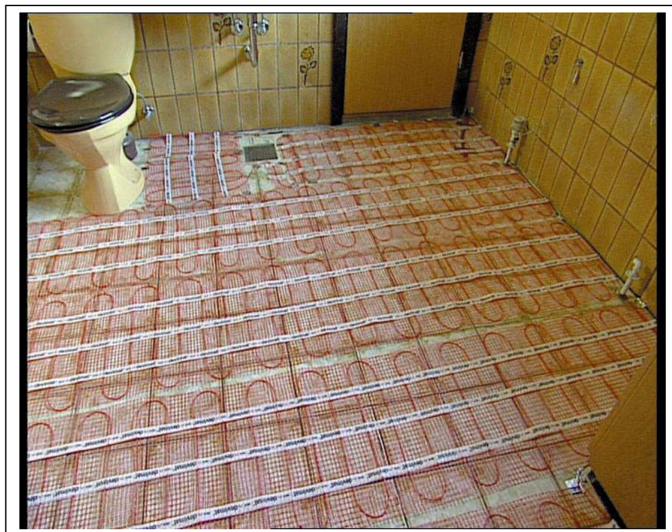
Рис. 3. Монтаж нагревательного мата devimat™ DSVF в ванной комнате.