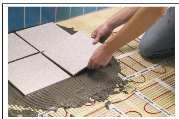
Рис. 4. Монтаж нагревательного мата devimat™ DSVF в ванной комнате на старую плитку.