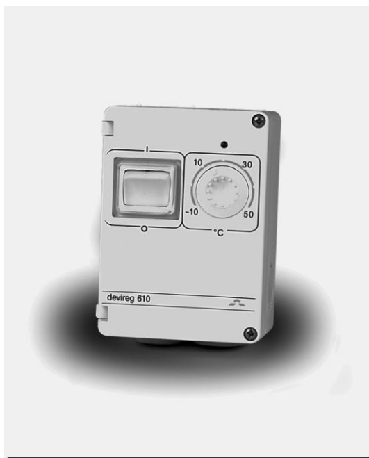
Рис. 1. Электронный терморегулятор devireg™610 .

Универсальный электронный терморегулятор с повышенной степенью защиты devireg™610 (рис. 1) применяется для управления электрическими кабельными системами обогрева (КСО) различного назначения (табл. 1), а также системами охлаждения в диапазоне температур от -10^{\circ}\text{C} до +50^{\circ}\text{C} . Может также быть использован для управления другими системами электроотопления или системами отопления с электрическими блоками контроля.